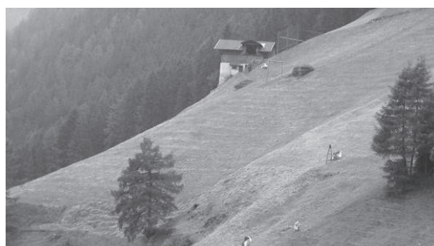
Maso in zona a forte pendenza

Annualmente avviene l’organizzazione della campagna, la raccolta delle domande di adesione,