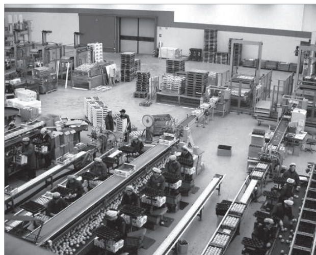
Sala di lavorazione

L'ufficio valuta tecnicamente e verifica i singoli progetti previsti dalla misura 123 del nuovo PSR. Beneficiari sono principalmente cooperative frutticole e viticole provinciali. Per il settore delle mele vengono finanziate ampliamenti, costruzioni, ristrutturazioni di celle ad atmosfera controllata, sale di lavorazione e nuove macchine selezionatrici.