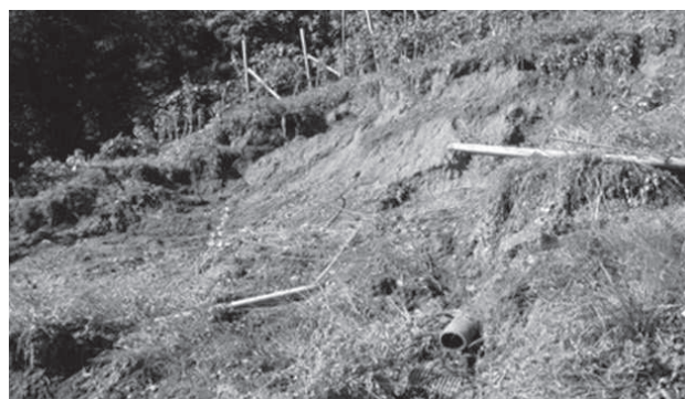
Danni da una frana in un vigneto.

Complessivamente sono state liquidate 290 domande per una spesa complessiva pari a € 1.063.973,00 .