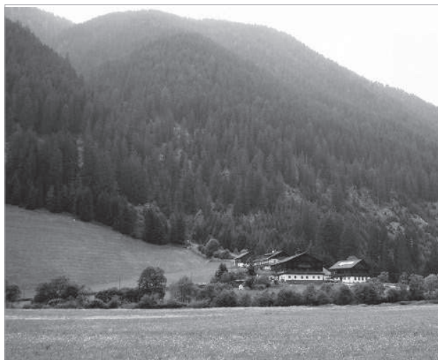
Zona strutturalmente svantaggiata

Nel 2011 sono state presentate relativamente alla misura 431 "Gestione dei gruppi d'azione locale, acquisizione di competenze e animazione" 4 domande d'aiuto, delle quali una concernente attività iniziate e terminate nel 2011, le rimanenti riferite a progetti previsti nel 2012.