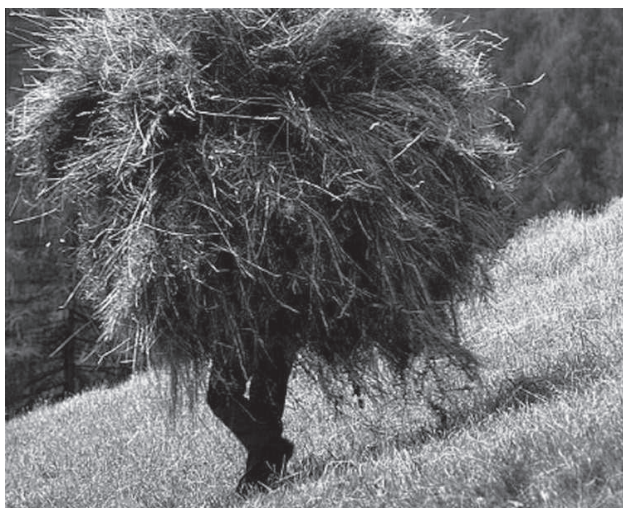
Tradizionale fienagione in montagna

I tecnici pianificano l'organizzazione della campagna annuale, la raccolta delle domande di conferma e/o di modifica (tramite SBB), l'istruttoria tecnico - amministrativa delle domande e la preparazione delle liste di liquidazione dei premi, collaborando con gli altri uffici provinciali.