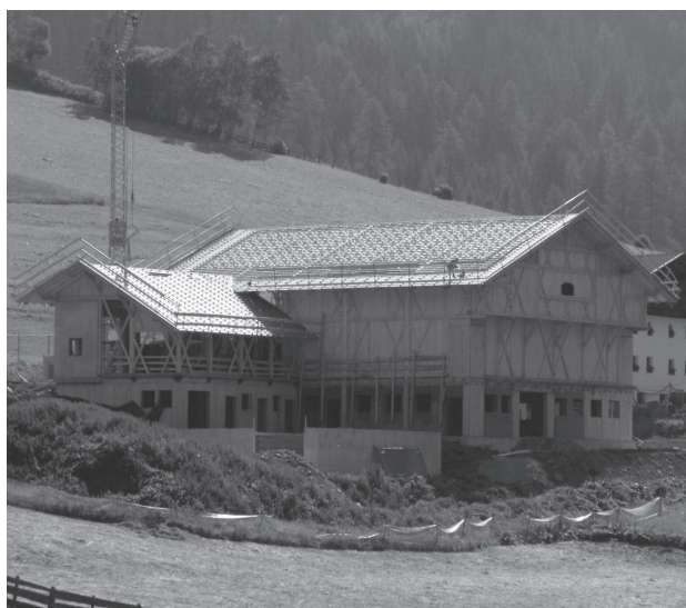
Stalla e fienile a Sarentino

Nello stesso anno sono state presentate in base alle relative leggi di incentivazione (L.P. del 11.01.1974, n. 1 e L.P. del 14.12.1998, n. 11) 1.237 nuove domande.