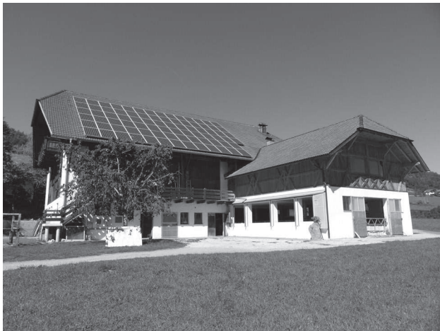
Stalla e fienile a Renon

Nell'anno di riferimento per la prima volta si è registrato un calo accentuato dell'attività edile nel settore agricolo. L'attuale crisi economica ha indotto, anche in agricoltura, un calo dei progetti edili. Il numero delle domande di finanziamento per edifici rurali e altri investimenti edili, il numero delle pratiche finanziate, in buona parte già presentate nell'anno scorso, così come i mezzi economici stanziati nel bilancio provinciale hanno raggiunto un minimo storico negli ultimi anni.