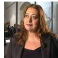
ZAHA HADID Baghdad, 1950

"Progettano ponti, chiese, shopping center e musei, costruiscono le stazioni e gli aeroporti del futuro, ridisegnano le skyline delle nostre metropoli". Così si presenta la collana I GRANDI MAESTRI DELL'ARCHITETTURA che il Centro Audiovisivi propone per avvicinarsi all'opera di 11 grandi che con i loro progetti modellano l'orizzonte del nostro vivere.