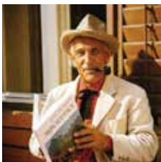
LUIS TRENKER Ortisei, 1892 – Bolzano, 1990

LUIS TRENKER Nato ad Ortisei, fu guida alpina, maestro di sci, scalatore, architetto, attore, regista, scrittore, ma anche faccendiere, violinista, pittore. Personaggio poliedrico dalle grandi passioni, un altoatesino che voleva vedere che cosa c'era oltre le sue montagne, se non eccelse in tutti gli ambiti in cui fu attivo, seppe comunque raggiungere sempre risultati apprezzabili, lasciando spesso il segno. Ancor oggi il personaggio sudtirolese più citato in internet è Luis Trenker.