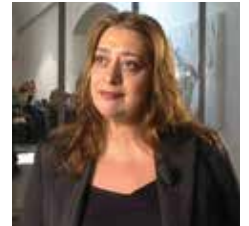
ZAHA HADID Baghdad, 1950

"Progettano ponti, chiese, shopping center e musei, costruiscono le stazioni e gli aeroporti del futuro, ridisegnano le skyline delle nostre metropoli". Così si presenta la collana I GRANDI MAESTRI DELL'ARCHITETTURA che il Centro Audiovisivi propone per avvicinarsi all'opera di 11 grandi che con i loro progetti modellano l'orizzonte del nostro vivere.