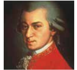
WOLFGANG AMADEUS MOZART Salisburgo, 1756 – Vienna, 1791