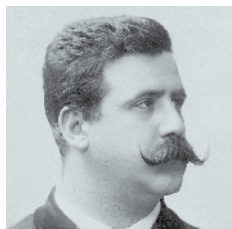
RUGGERO LEONCAVALLO Napoli, 1857 Montecatini Terme, 1919

OPERA LIRICA Il compositore italiano, autore di opere liriche e operette, Ruggero Leoncavallo nasce a Napoli nel 1857. Inizia privatamente a studiare il pianoforte. Si Diploma al Conservatorio di San Pietro a Majella di Napoli nel 1874, e scrive la partitura dell'opera storica Chatterton , rappresentata solo nel 1896 a fama raggiunta. Insegna privatamente il pianoforte e suona nei caffè concerto in Francia e in Inghilterra. Uno zio lo invita in Egitto dove dal 1882 è attivo per qualche anno presso la corte. La guerra anglo-egiziana lo costringe a lasciare l'Egitto e a trasferirsi in Francia. Grazie al baritono Maurel, entra in contatto con l'editore Ricordi, da cui ottiene la commissione per una trilogia, il Crepusculum , che nelle intenzioni del compositore deve comprendere I Medici , Savonarola e Cesare Borgia . Riesce solo a comporre I Medici , che andrà in scena senza troppo successo nel 1893. Spronato dal successo di Cavalleria rusticana di Mascagni, Leoncavallo si dedica febbrilmente alla stesura di una nuova opera: Pagliacci . L'opera, presentata nel 1892 al Teatro Dal Verme di Milano con la direzione di Arturo Toscanini, è un clamoroso successo.