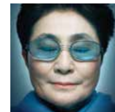
YOKO ONO Tokyo, 1933