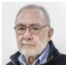
GERHARD RICHTER Dresda, 1932

LA FIGURA UMANA Liberatasi dalla sua connotazione celebrativa, la ricerca nella raffigurazione della figura umana, scandaglia nuovi territori espressivi. Dopo gli orrori delle due guerre mondiali, il ritratto racconta delle drammatiche esperienze personali con un'intensità che l'arte astratta non soddisfa. L'espressionismo astratto e l'informale approfondiscono le loro ricerche espressive allontanandosi da un forte impatto emotivo condivisibile, identificabile nella raffigurazione del corpo umano. I dipinti di Francis Bacon riflettono i conflitti interiori dell'artista, volti e corpi vengono deformati raggiungendo vette espressive difficili da ritrovare in altri pittori. La sacralità della figura umana permea l'opera di Graham Sutherland. Influenzato dal surrealismo la sua ricerca lo spinge a cercare i segreti, intrecciati nella realtà quotidiana, dell'inconscio. La verità emotiva nel corpo nudo, rappresenta per Lucian Freud l'essenza dell'uomo; Freud ne ricerca la sua fragilità espressiva, mentre i fondi sono resi a tinte neutre. Gerhard Richter usa la fotografia nella sua ricerca, per riprodurre in pittura una nuova realtà raffigurata nei suoi famosi ritratti sfuocati.