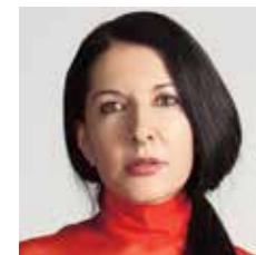
MARINA ABRAMOVIĆ Belgrado, 1946

PERFORMANCE E BODY ART Il corpo dell'artista diventa palcoscenico, il fulcro dal quale partono nuove strategie espressive. Radicalizzando le prime esperienze nello spazio pubblico delle avanguardie storiche, negli anni Sessanta si forma una nuova espressione artistica: la performance. L'uso del corpo come linguaggio che parla della rivendicazione ecologica, femminista, pacifista e della critica alla mercificazione dell'arte moderna. Diversi sono gli approcci tematici fra le maggiori personalità che si esprimono attraverso un'esperienza artistica condivisa nello spazio e nel tempo, vissuta nel momento. Ritroviamo una forte componente mistico-rituale nella ricerca artistica affrontata da Marina Abramović, Joseph Beuys e Hermann Nitsch. L'artista confronta e libera il proprio pubblico da paure e sofferenze entrando così in un territorio quasi mistico. Una forte sensibilità sociale e politica scorre attraverso le performance concettuali di Hans Haacke. La ricerca di Bruce Nauman lo porta a vedere le sue performance e installazioni con tubi al neon come una denuncia del ruolo dell'artista come manipolatore del linguaggio visivo odierno.