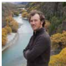
RICHARD SIDEY Wellington, 1982

RICHARD SIDEY Fotografo e documentarista neozelandese, si dedica alla documentazione del paesaggio. La sua motivata sensibilità verso l'ambiente lo porta a visitare le regioni remote polari, gli Stati Uniti d'America e il Canada. Nel 2003 si imbarca nel porto di Hobart sulla nave russa Icebreaker, in un'esplorazione dell'Antartide. Questa esperienza, durata tre mesi, cambia le sue prospettive professionali, grazie alla scoperta delle bellezze di flora e di fauna del luogo. Le vaste distese di ghiaccio lo affasciano, arricchite dalla presenza di animali che riescono a vivere in condizioni climatiche estreme. Immagini che ripropone nel suo documentario sperimentale del 2011, che ripercorre i suoi viaggi in Antartide, nella Giorgia del Sud, nella Groenlandia e nell'arcipelago del mare Glaciale Artico (Svalbard). Per accentuare la maestosità del paesaggio l'immagine dello schermo del video viene divisa in tre parti. All'interno delle tre inquadrature le immagini si alternano, creando un particolare ritmo visivo che accentua le diverse impressioni paesaggistiche, arricchito dalla presenza della popolazione animale che vive in quei luoghi.