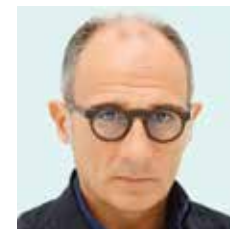
FRANCO FONTANA Modena, 1933

FRANCO FONTANA Fotografo, fotoreporter e scrittore italiano, che dal 1960 propone un approccio personale al paesaggio. La sua ricerca si concentra sulle forme e geometrie cromatiche che scorge nel paesaggio naturale e urbano. Colori primari rafforzati da composizioni geometriche, forti del suo gusto per la composizione fotografica e dalla mancanza della figura umana. I suoi viaggi nelle metropoli internazionali sensibilizzano il suo sguardo e il suo gusto estetico. Le sue opere sono state pubblicate su oltre 40 libri fotografici e sono state esposte in numerose mostre in Italia e all'estero, dal Museum of Modern Art di New York al Musée d'Art Moderne di Parigi, all'Australian National Gallery di Melbourne. Al suo percorso professionale si aggiungono commissioni in ambito pubblicitario e collaborazioni con testate internazionali quali Vogue, Time, Frankfurter Allgemeine, per citarne alcune. Nei suoi numerosi workshop propone percorsi formativi culturali arricchiti da una solida base della conoscenza tecnica della fotografia; conoscenza tecnica che aiuta a rappresentare al meglio lo sguardo, l'idea e la sensibilità del fotografo.