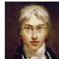
JOSEPH MALLORD WILLIAM TURNER Londra, 1775 Chelsea, 1851

JOSEPH MALLORD WILLIAM TURNER Pittore inglese dalla spiccata personalità, contraddistinto da un approccio lirico nei confronti della raffigurazione paesaggistica. Incoraggiato dal padre, nonostante le modeste condizioni economiche della famiglia, frequenta la Royal Academy. Inizialmente si forma come incisore e acquarellista, ma dal 1796 si dedica anche alla pittura a olio. Opera dapprima nel solco della tradizione topografica, riproducendo i luoghi visitati durante i suoi numerosi vagabondaggi nelle campagne inglesi. Per qualche tempo lavora per il dottor Monro, collezionista e protettore di giovani artisti, copiando e studiando gli schizzi del paesaggista J. R. Cozens. Grazie a questi studi si concentra sul trascendere il dato figurativo realistico verso una visione più libera e lirica del paesaggio che lo circonda. Pur non dimenticando la lezione dei maestri del passato, Turner elabora una tecnica personale per raffigurare su tela effetti atmosferici e luministici, a volte drammatici. Grazie alla luce le forme perdono consistenza, i contorni e i colori puri sono protagonisti del quadro. Una luce filtrata e trasfigurata dallo straordinario lirismo dell'artista.