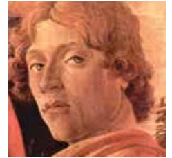
SANDRO BOTTICELLI (ALESSANDRO DI MARIANO DI VANNI FILIPEPI)

SANDRO BOTTICELLI Pittore italiano. Allievo del Lippi e poi del Verrocchio, esordisce con una serie di Madonne, che concretizzano una personale plasticità e denotano una saldezza nella composizione delle figure. Nel 1470 apre una sua bottega e viene introdotto nell'ambiente dei Medici. Di questo periodo alcuni dei suoi capolavori: la Pala di Sant'Ambrogio (1470) e il Dittico di Giuditta (1472-73) degli Uffizi, le due Adorazioni dei Magi (1475) e la Primavera (1478). La Primavera esprime il raffinato clima umanistico fiorentino della corte di Lorenzo il Magnifico. Nel 1481 si trasferisce a Roma per affrescare nella Cappella Sistina tre storie ( Mosè e le figlie di Jetro , la Punizione di Core e le Prove di Cristo ) e alcune figure di Pontefici (1482). La Nascita di Venere (1482), concepita come pendant alla Primavera , riflette l'insorgere di una nuova passione religiosa e di una ricerca espressiva che sfocia nella complessa Pala di San Marco (1490), e nei disegni (1490-97) per illustrare la Divina Commedia . Una profonda crisi mistica, che coincide con la caduta degli ideali umanistici, accelerata dalle prediche del Savonarola e dal rifiuto della cultura classicheggiante.