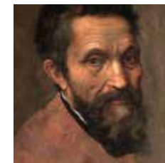
MICHELANGELO BUONARROTI Caprese, 1475 Roma, 1564

MICHELANGELO BUONARROTI Scultore, pittore, architetto e poeta italiano. Discendente da un'antica famiglia fiorentina, viene avviato agli studi sotto la guida dell'umanista Francesco da Urbino. Presto manifesta una forte inclinazione artistica e viene accolto presso la bottega del Ghirlandaio (1488) con un apprendistato di tre anni. Dopo un anno decide di frequentare i giardini medicei di San Marco, dove studia le sculture antiche esposte. Le sue prime opere suscitano l'ammirazione di Lorenzo il Magnifico, che lo accoglie a palazzo dove studia gli umanisti della cerchia medicea, approfondendo le dottrine platoniche. Morto Lorenzo lascia Firenze e si trasferisce prima a Bologna (1494) e poi a Roma (1496). Il suo virtuosismo tecnico, supportato dalla scienza anatomica, confluisce nella Pietà vaticana, scolpita a Roma nel 1501. Conclusa l'esperienza decennale romana, ritorna a Firenze dove lavora fra l'altro al Tondo Pitti (1503-04), alla Madonna di Bruges (1503-05) e al David (1501-05) marmoreo. Nel maggio 1508 sottoscrive il contratto per la decorazione della volta della Cappella Sistina, terminata in soli quattro anni di accanito e solitario lavoro.