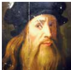
LEONARDO DA VINCI Anchiano, 1452 Amboise, 1519

LEONARDO DA VINCI Pittore, scultore, ingegnere, architetto e scrittore italiano. Figlio del notaio Piero da Vinci viene accolto nella bottega di Andrea del Verrocchio a Firenze. Apprende rapidamente una vasta e approfondita conoscenza delle diverse tecniche artistiche, collaborando direttamente col maestro all'esecuzione del Battesimo di Cristo , fornendogli idee per numerose opere di scultura. Nella visione del giovane artista definita nella sua complessità e originalità, si concretizza l'indipendenza dai modelli stilistici della tradizione toscana. Si trasferisce a Milano, dove tra il 1495 e il 1498 dipinge Il Cenacolo , una delle opere capitali di tutto il rinascimento per la solenne monumentalità della composizione. L'espressività dei gesti esprime l'intimità dei moti interiori raffigurati con una vigorosa innovazione dell'iconografia tradizionale dell' Ultima Cena . L'ambiente culturale lombardo stimola l'incessante germogliare di nuove idee, e le ricerche dell'artista nei campi diversi dell'arte e della scienza. Rientrato a Firenze, inizia il ritratto di donna, noto come la Gioconda (1503-06); opera dipinta a olio su tavola di pioppo con le dimensioni di 77x53 cm.