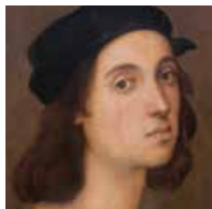
RAFFAELLO SANZIO Urbino, 1483 Roma, 1520

RAFFAELLO SANZIO Pittore e architetto italiano. Figlio del pittore Giovanni Santi, riceve la prima educazione pittorica nella bottega del padre. Dopo la morte del padre entra in contatto con gli ambienti artistici fiorentini, in un momento di vivacissima ripresa culturale grazie alla contemporanea presenza di Leonardo e Michelangelo. A partire dal 1504 si divide fra Firenze, Perugia e Urbino, dove mantiene stretti legami con la corte di Montefeltro. Durante questo periodo dipinge San Giorgio e il drago (1505), San Michele e il drago (1505) e la Madonna con il Bambino (1506). I modelli leonardeschi appaiono rielaborati con originalità, con un'interpretazione che mette in risalto la naturalità della composizione fra le movenze e i rapporti psicologici dei personaggi raffigurati. Nel 1508 si trasferisce a Roma, dove prende parte, accanto ad altri artisti, alla decorazione delle Stanze nei nuovi appartamenti di Giulio II. Ben presto ottiene la responsabilità completa della Stanza detta "della Segnatura", consolidando così la sua fama a corte. La sua bravura lo porta a realizzare progetti per scene teatrali, e ad approfondire gli studi archeologici.