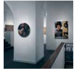
GALLERIA GOETHE Bolzano, 1964–2015