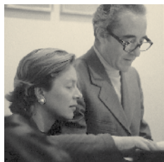
GIUSEPPE PANZA DI BIUMO Milano, 1923–2010

GIOVANNA E GIUSEPPE PANZA Il racconto di Giuseppe Panza e di sua moglie, svela, lungo la vita della loro collezione, un percorso di appassionata ricerca e insieme di lucida analisi e scelte decise attraverso gli snodi fondamentali dell'arte contemporanea. Dal 1955 al 2010 Giovanna e Giuseppe Panza, hanno creato una raccolta di oltre duemilacinquecento opere di arte informale, espressionismo astratto, pop art, minimalismo, arte concettuale, arte ambientale, arte organica e arte monocroma oggi esposta in alcuni dei principali musei d'arte contemporanea del mondo. La grande passione per l'arte ha gettato le basi per un'esperienza senza pari e, la loro selezione ha fatto sì che artisti come Rauschenberg, Kline e altri entrassero all'interno del sistema dell'arte. Dopo un primo viaggio dei coniugi in America nel 1954 era forte l'esigenza di far conoscere in Europa quel clima artistico e culturale. L'arte americana ha affascinato i Panza, che hanno deciso di portare avanti un progetto di collezione particolarissimo per quegli anni. Le opere che hanno scelto e comprato sono accumulate dall'idea che l'artista abbia grande fiducia nella vita.