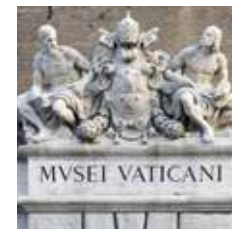
MUSEI VATICANI Roma, 1506