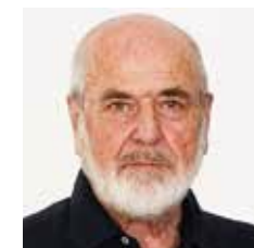
MICHELANGELO PISTOLETTO Biella, 1933