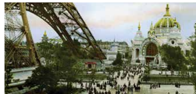
Alcune immagini tratte dal DVD "Marcel Proust e la memoria del tempo"