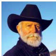
JAMES TURRELL Pasadena, 1943

JAMES TURRELL Artista americano, esponente di spicco della Land Art. Termine introdotto nel 1969 che indica azioni di utilizzazione o trasformazione di un luogo naturale, per lo più su vasta scala, come sviluppo di tematiche concettualiste. Tali opere, di non facile fruizione diretta, circolano in registrazioni filmiche e riprese fotografiche; oppure si concretizzano in mappe, che restituiscono le coordinate dell'intervento. Lavorando principalmente con la luce, Turrell ne studia l'influenza percettiva e psicologica in ambienti creati su misura. Il suo progetto più ambizioso rimane il Roden Crater Project . Iniziato nel 1974 questo progetto artistico si sviluppa all'interno del cratere di un vulcano spento. Scavando al suo interno ambienti e una rete di gallerie, Turrell ha creato uno spettacolare osservatorio sulla luce. Permettendo così allo spettatore l'esperienza unica al mondo di osservare le variazioni del cielo e del sole.