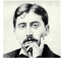
MARCEL PROUST Auteuil-Neuilly-Passy, 1871 Parigi, 1922

MARCEL PROUST Valentin Louis Georges Eugène Marcel Proust nasce a Parigi il 10 luglio 1871. Di natura ipersensibile, non riusciva ad addormentarsi senza il bacio della buona notte di sua madre. Questo bacio, le paure e le gioie a esso collegate, formano uno dei temi che ritroviamo nella sua opera prima Jean Santeuil (1895) e nel suo unico e monumentale romanzo Alla ricerca del tempo perduto (1913). Conduce una vita mondana frequentando i salotti dell'aristocrazia parigina, dove conosce compositori, artisti e letterati. La morte dei genitori presenta all'autore una dolorosa occasione per riflettere sul trascorrere del tempo e sulla memoria del passato. Proust prende in affitto un appartamento in Boulevard Haussmann e inizia a scrivere il suo capolavoro. Se il primo volume della sua opera passa inosservato, il secondo, All'ombra delle fanciulle in fiore (1919), gli assicura la gloria con il premio Goncourt. Pervaso da un'idea classica dell'amore, Proust si muove all'interno della tradizione francese, che unisce Racine, Stendhal e Flaubert. Lo scrittore consacra gli ultimi anni della sua vita all'ultimazione del romanzo che rimane incompiuto.