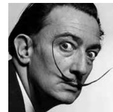
SALVADOR FELIPE JACINTO DALÍ Figueres, 1904 Figueres, 1989

SALVADOR DALÍ Pittore spagnolo. A Madrid frequenta la scuola di belle arti dove incontra lo scrittore Federico García Lorca e il regista Luis Buñuel. Influenzato da suggestioni futuriste, metafisiche e cubiste segue con interesse le opere di Max Ernst e conosciuti André Breton e Paul Éluard, aderisce nel 1929 al surrealismo. Egli ne dà tuttavia un'interpretazione molto personale, caratterizzata dalla combinazione della psicoanalisi freudiana con la pittura di de Chirico, Magritte, Ernst e Tanguy. Ne risulta una pittura basata su un realismo illusionistico, fondata su un'intensa concentrazione di immagini legate alle sue ossessioni personali. Nel 1930 Dalí pubblica il saggio La donna visibile , dedicato a Gala, sua moglie, musa e modella di tutta la vita. Alla pittura affianca la sua collaborazione con Buñuel alla sceneggiatura di due film Le chien andalou (1929) e L'âge d'or (1930). Scrivono la sceneggiatura de Le chien andalou seguendo la tecnica della "scrittura automatica". Niente nel film deve risultare logico, razionale, spiegabile psicologicamente o culturalmente. Il film soddisfa così le richieste di irrazionalità totale, postulata da André Breton nel manifesto surrealista.