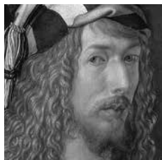
ALBRECHT DÜRER Norimberga, 1471 Norimberga, 1528

ALBRECHT DÜRER Pittore e grafico tedesco. Figlio di un orafo immigrato dall'Ungheria, compie un breve apprendistato nella bottega paterna, dove impara a maneggiare il bulino. Acquista una solida preparazione come pittore e grafico lavorando nella bottega di Michael Wolgemut e Wilhelm Pleydenwurff, specializzata anche nella xilografia. I suoi viaggi, anche in Italia, gli permettono di approfondire le sue cognizioni nell'illustrazione di libri, e di avvicinarsi all'arte classica e rinascimentale italiana. Lo affascinano il paesaggio italiano e i suoi colori, le vedute di città e di montagne, che fissa in acquarelli. Rientrato a Norimberga apre la sua bottega nel 1495, e raggiunge una certa fama grazie alla serie di 14 xilografie dell' Apocalisse (1498). Senza precedenti appaiono gli effetti luministico-chiaroscurali ottenuti variando accuratamente lo spessore lineare dei contorni e del tratteggio interno. Nel 1520 compie un viaggio nei Paesi Bassi, dove rinvigorisce la sua passione per il ritratto, di cui lascia in questi anni splendide prove. Negli ultimi anni della sua vita si dedica ai ritratti della fiorente borghesia di Norimberga e alla stesura di trattati teorici.