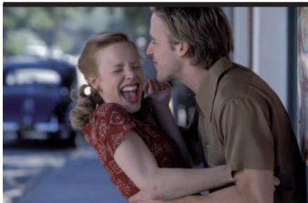
Film Still: Le pagine della nostra vita

Un vecchio medico parte in auto con la nuora, carica una coppia di autostoppisti, va a trovare la vecchissima madre, arriva all'università di Lund dove si festeggia il suo giubileo, il 50. anniversario della sua attività professionale. Alle vicende del viaggio si alternano sogni, incubi, ricordi che si fanno parabola sulla morte nascosta dietro le apparenze della vita. È, forse, il più alto risultato di Bergman negli anni '50. Orso d'oro al Festival di Berlino 1958 e molti altri premi. Il grande regista e attore Sjöström (1879-1960) morì 3 anni dopo le riprese.