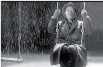
Film Still: Vivere Regia: Akira Kurosawa

Malato di tumore, anziano funzionario giapponese si dedica interamente all'impresa di trasformare una zona palustre in un campo di giochi per bambini. Quando muore, soltanto le madri dei bambini si ricordano di lui. Potente affresco di vita giapponese con una struttura narrativa insolita (per l'epoca), permeato di un'angoscia esistenziale che rimanda a Dostoevskij, indimenticabile ritratto di un uomo solo davanti alla morte, è uno dei grandi film sulla vecchiaia in cui convivono emozione e rigore, realismo e simbolismo, lirismo e sarcasmo.