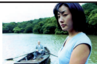
Film Still: Primavera, Estate, Autunno, Inverno... e ancora Primavera Regia: Kim Ki-duk

Vicini alle nozze d'oro, i coniugi Thayer ospitano nel loro cottage estivo su un lago del New Hampshire la figlia col nuovo fidanzato che porta con sé il figlio, un tredicenne irrispettoso. Lasciato solo con i due vecchi, il ragazzino si fa conquistare. Scene di un vecchio matrimonio senza risparmio di commozione. Potrebbe essere un film di Bergman in vena sentimentale, riveduto da Marino Moretti e corretto da Carlo Cassola. Grande successo di pubblico, 9 nomination ai premi Oscar e 3 statuette: K. Hepburn (al suo 4° premio), H. Fonda e sceneggiatura.