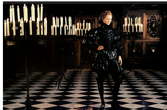
Film Still: Orlando

Inghilterra, fine Ottocento. Le vicissitudini e i drammi sentimentali di una giovane donna, di umili origini, sedotta e abbandonata da un uomo senza scrupoli. Dal romanzo Tess dei D'Urbervilles (1891) di Thomas Hardy, Polanski ha tratto un film aderente al testo in cui emergono tre temi centrali: natura, amore e destino. Lungo ma non prolisso. Molto decorativo, sebbene squisito, nell'ultima parte trova la sua giusta combustione drammatica. Vincitore di tre premi Oscar nel 1980: miglior fotografia, miglior sceneggiatura, migliori costumi.