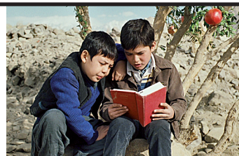
Film Still: Il cacciatore di aquiloni Regia: Marc Forster

Dal romanzo omonimo (1945) di Carlo Levi (1902-75): un intellettuale torinese, medico e scrittore antifascista a contatto con l'antica civiltà contadina della Lucania dov'è confinato intorno al 1935. Francesco Rosi mette la sordina alla dimensione antropologica e magica del bel libro di Levi e l'accento su quella sociale e politica. Ammirabile per l'intensità della sua delicatezza. Accanto a un Gian Maria Volonté introspettivo e sommo e ad attori naturali ben guidati c'è un ottimo Paolo Bonacelli.