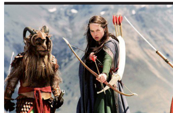
Film Still: Le cronache di Narnia – Il leone, la strega e l'armadio Regia: Andrew Adamson

Dimenticandosi dell'originale musical del 1971, Burton impone ancora una volta il suo genio visivo e strabilia in questa versione del capolavoro per ragazzi di Roald Dahl, firmando un'opera gotica e allucinata, un disperato viaggio nel mondo desolato e amaro del diverso, ma anche una riflessione sul cinismo di una vendetta tardiva. Baciato dalla fortuna, il piccolo Charlie trova uno dei 5 biglietti d'oro che gli permetteranno di visitare la leggendaria fabbrica di cioccolato del misterioso Willy Wonka.