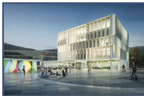
Rendering NOI Techpark Bruneck / Rendering NOI Techpark Brunico