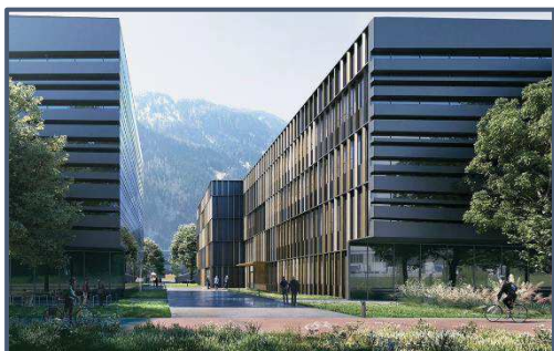
Rendering D2/D3 und Rendering B1, NOI Techpark Bozen / Rendering D2/D3 e rendering B1, NOI Techpark Bolzano

Im Jahr 2022 beginnen zudem die Arbeiten am Gebäude für die neue Fakultät für Ingenieurwesen der Universität Bozen.