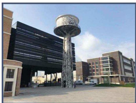
NOI Techpark Bozen / NOI Techpark Bolzano

Für 2024 ist die Fertigstellung der Fakultät für Ingenieurwesen sowie der Erweiterungsmodule D2 und D3 geplant. Die Fakultät entsteht aus der Fusion des Ingenieurbereichs der heutigen Fakultät für Naturwissenschaften und Technik mit der bestehenden Fakultät für Informatik. Damit werden neue Kompetenzen im Bereich der Elektro- und Informationstechnologie geschaffen. Die Module D2 und D3 werden den beiden Themen „grüne Technologien“ (Green Technologies) und „Lebensmitteltechnologien“ (Food Technologies) gewidmet sein.