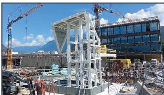
Rendering NOI Techpark Bruneck / Rendering NOI Techpark Brunico

In Bruneck entstehen auf einer Fläche von rund 6.000 m 2 zwei Bereiche: NOI Techpark Research, Kompetenzbereich der Freien Universität Bozen, und NOI Techpark Business mit speziellen Services zur Unterstützung von Unternehmen, Forschungseinrichtungen und Start-ups sowie mit Coworking-Spaces. Darüber hinaus stellt der NOI Techpark Bruneck eine Mehrzweck-Struktur dar, die sich in den städtischen Kontext integriert und den Bürgern offensteht: mit dem neuen Veranstaltungszentrum NOBIS, einer Gastronomie und einer Tiefgarage mit 380 Parkplätzen. Der Abschluss des Baus und die Eröffnung sind für 2023 geplant.