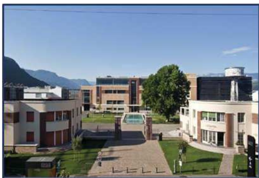
NOI Techpark Bozen / NOI Techpark Bolzano

Für 2024 ist die Fertigstellung der Fakultät für Ingenieurwesen geplant. Die Fakultät entsteht aus der Fusion des Ingenieurbereichs der heutigen Fakultät für Naturwissenschaften und Technik mit der bestehenden Fakultät für Informatik. Damit werden neue Kompetenzen im Bereich der Elektro- und Informationstechnologie geschaffen. Die Realisierung der Erweiterungsmodule D2 und D3 wird voraussichtlich bis Dezember 2023 dauern. Die Module werden den beiden Themen „grüne Technologien“ (Green Technologies) und „Lebensmitteltechnologien“ (Food Technologies) gewidmet sein.