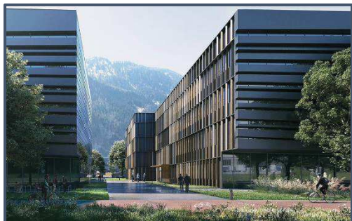
Rendering D2/D3 und Rendering B1, NOI Techpark Bozen / Rendering D2/D3 e rendering B1, NOI Techpark Bolzano

Im Jahr 2023 wird zudem am Gebäude für die neue Fakultät für Ingenieurwesen der Universität Bozen weitergearbeitet.