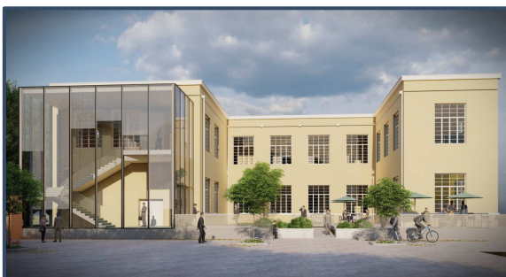
Rendering A6 und Modell B1 / Rendering A6 e plastic B1

Die neue Fakultät für Ingenieurwesen mit knapp 90.000 m 3 , wird bis 2023 direkt daneben auf dem Baulos B1 entstehen. Für dieses Baulos ist nun nach Genehmigung des neuen Gefahrenzonenplanes Flughafen Bozen die Baukonzession beantragt. Aktuell werden die Vergabeverfahren für die Bauarbeiten vorbereitet. Die Bauarbeiten sollen im Sommer 2021 beginnen.