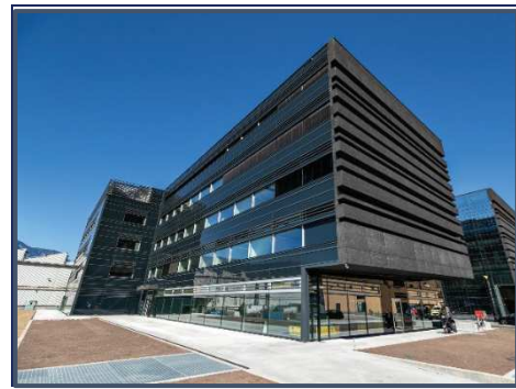
NOI Techpark Bozen / NOI Techpark Bolzano

Nel NOI Techpark sono insediate attualmente circa 70 imprese.