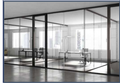
Rendering NOI Techpark Bruneck / Rendering NOI Techpark Brunico