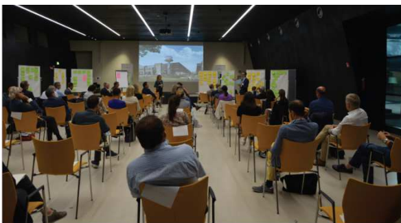
Hauptworkshop vom 21. September 2020 / Workshop principale del 21 settembre 2020

Als zusätzlich bedeutsame Bereiche soll in der Strategie zudem auf die Kreativwirtschaft und die Aus- und Weiterbildung eingegangen werden. Zu diesen vier Spezialisierungsbereichen wurden während des Workshops an entsprechenden Arbeitstischen jeweils Themen, Unterthemen und auch bereits Ziele definiert.