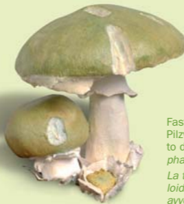
Fast 90% aller tödlich verlaufenden Pilzvergiftungen gehen auf das Konto des Knollenblätterpilzes ( Amanita phalloides ). La tignosa verdognola ( Amanita phalloides ) è la causa del 90% di tutti gli avvelenamenti fungini mortali.

Nel corso della storia numerosi personaggi evidentemente poco graditi furono eliminati utilizzando funghi velenosi . Per un piatto di funghi preparato dalla moglie Agrippina morì, ad esempio, nel 54 d.C. l'Imperatore romano Claudio. Un simile destino sorprese anche nel 1534 Papa Clemente VII.