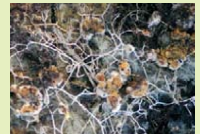
Mykorrhiza-Myzel | Micelio di micorrizza

Gran parte dei funghi del bosco vive in stretta relazione con gli alberi . I funghi micorrizici formano una simbiosi, ovvero una relazione tra esseri viventi con vantaggi reciproci. Le ife fungine avvolgono le radici degli alberi e a volte penetrano al loro interno. In questo modo facilitano all'albero l'assorbimento delle sostanze dal terreno e lo riforniscono di acqua, sali minerali e azoto. Dall'altra parte il fungo riceve dall'albero soprattutto carboidrati . La collaborazione è per l'albero molto efficace . In corrispondenza delle radici interessate dalla simbiosi, la pianta non forma più radici fini o peli radicali, il lavoro di assorbimento di acqua e sostanze nutritive viene lasciato al fungo .