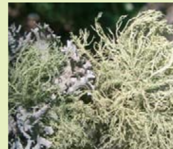
Flechten, wie das Baummoos ( Pseudevernia spp.) und der Baumbart ( Usnea spp.), sind zusammengesetzte Organismen aus Pilzen und Algen.