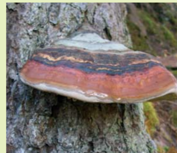
Der ledrige, holzige Fruchtkörper des Rotrandigen Baumschwamms ( Fomitopsis pinicola ) kann über 10 Jahre alt werden.

Unsere Aufgabe aber ist es, die Pilze in ihrem natürlichen System zu erhalten und zu schützen!