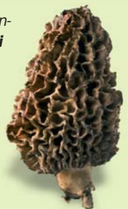
Morcheln beinhalten 60 mal soviel Vitamin D wie Kuhmilch. Le spugnole contengono una quantità di vitamina D circa 60 volte superiore al latte vaccino.

In Europa esistono circa 150 tipi di funghi velenosi , 40 dei quali pericolosi, 10 mortali.