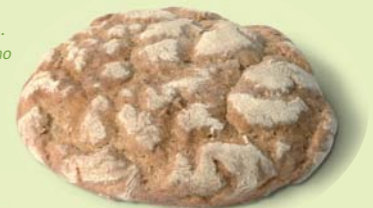
Hefepilze zum Brotbacken. I saccaromiceti permettono la lievitazione del pane.

Alcuni funghi dannosi possono distruggere ed avvelenare le derrate alimentari oppure possono essere portatori di malattie . Le malattie fungine in agricoltura provocano danni ingenti. Le muffe nelle case sono causa di allergie. Gli uomini possono essere aggrediti dai funghi, i lieviti ad esempio possono paralizzarne il sistema immunitario .