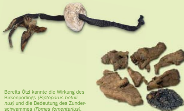
Bereits Ötzi kannte die Wirkung des Birkenporlings ( Piptoporus betulinus ) und die Bedeutung des Zunderschwammes ( Fomes fomentarius ). Già Ötzi conosceva le proprietà del poliporo della betulla ( Piptoporus betulinus ) e l'importanza del fungo dell'esca ( Fomes fomentarius ).

I funghi commestibili sono costituiti per il 90% da acqua ed il loro valore nutritivo è piuttosto basso. Contengono vitamina B, C e D, calcio, magnesio ed altre sostanze minerali, nonché tracce di manganese, zinco e selenio . A causa del contenuto in chitina sono poco digeribili .