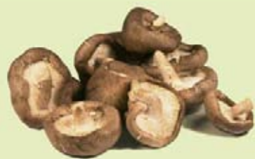
In China wird der Shiitake Pilz ( Lentinula edodes ) seit über 1000 Jahren angebaut. Er dient zur Heilung von Krankheiten. In Cina lo Shiitake ( Lentinula edodes ) viene coltivato da oltre 1000 anni. Viene impiegato nella cura di malattie.

Schon in der Steinzeit waren Pilze für den Menschen überlebenswichtig. Ötzi, der Mann aus dem Eis, 2400 v. Chr. trug in seiner Tasche Pilze mit sich: Birkenporlinge dienten zur Wundheilung, Zunderschwamm zum Entfachen von Feuer. Im Reich der Pharaonen und im antiken Griechenland waren die berausenden Wirkungen einiger Pilze bei Priestern und Priesterinnen bekannt. Medizinleute und Schamanen benutzen seit Jahrtausenden Pilze zur Heilung.