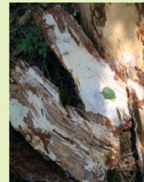
Hallimasch, Pilzhyphen unter der Rinde Parasit, Saprophyt und Symbiont Ife fungine d'armillaria sotto corteccia, parassita + saprofita + simbiote ( Armillaria ssp. )