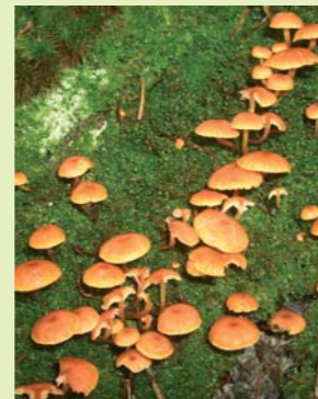
Samtfußrübling, Saprophyt Saprofita ( Flammulina velutipes )

Es gibt auch Pilze, die von totem Material leben, man bezeichnet sie als Saprophyten . Sie erfüllen als Zerstörer und Zersetzer von organischem Material eine wichtige Aufgabe im Naturhaushalt und leisten einen großen Beitrag zum ökologischen Gleichgewicht . Zusammen mit vielen anderen Kleinstlebewesen sorgen sie dafür, dass die toten Pflanzenteile in Humus und Mineralstoffe zersetzt werden, die wiederum für andere Pflanzen eine neue Nahrungsquelle bilden.