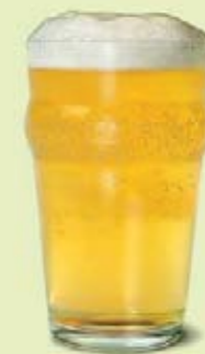
Zum Bierbrauen braucht es Hefepilze. Per preparare la birra sono necessari i saccaromiceti.