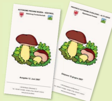
Der Pilzschutz ist in Südtirol mit Landesgesetz geregelt. Infos zum Pilzesammeln im Faltblatt der Abteilung Forstwirtschaft ( www.provinz.bz.it/forst ).