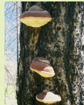
Rotrandiger Baumschwamm, Parasit und Saprophyt Fungo dell'esca, parassita + saprofita ( Fomitopsis pinicola )