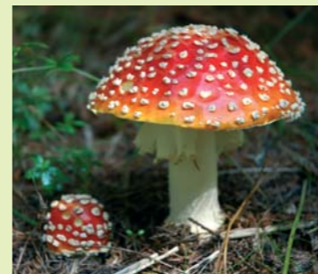
Schillernd und giftig: der Fliegenpilz ( Amanita muscaria )