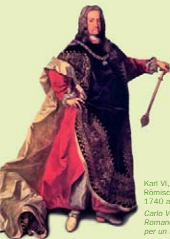
Karl VI, Kaiser des Heiligen Römischen Reiches, starb 1740 an einer Pilzvergiftung. Carlo VI, Imperatore del Sacro Romano Impero, morì nel 1740 per un avvelenamento da funghi.

In Europa gibt es etwa 150 Giftpilze , 40 davon sind gefährlich, 10 tödlich.