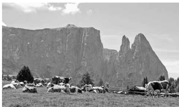
Bovini al pascolo all'Alpe di Siusi