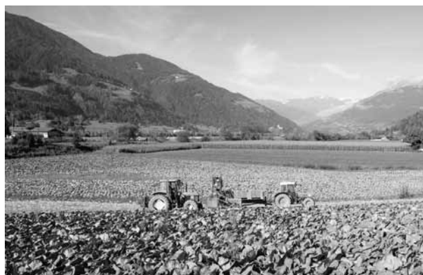
Nel 2010 le spese ammissibili hanno subito variazioni.

Nel 2012 sono state inoltrate 13.210 domande di assegnazione di carburante e/o combustibile agevolato ed assegnati 26.295.732 litri di gasolio e 667.161 litri di benzina.