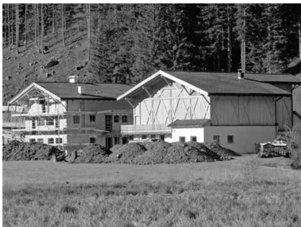
Nuova costruzione della sede dell'azienda agricola

Nell'anno 2012 si è registrato un ulteriore calo dell'attività edile rispetto all'anno passato. Sia il numero globale delle domande per incentivi per opere edili che l'importo totale dei contributi concessi hanno subito una lieve flessione. Si è assistito dunque ad una prosecuzione della tendenza in atto già a partire dall'anno 2009.