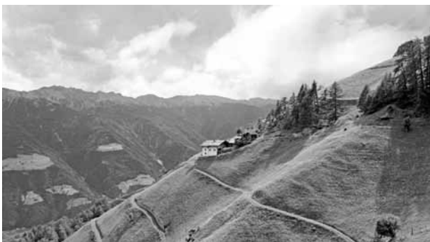
Maso in zona a forte pendenza

La presente misura prevede, ogni anno, il pagamento di un'indennità compensativa volta a migliorare il reddito degli agricoltori nelle zone interessate, ad assicurare ed incentivare il proseguimento dell'attività agricola e a conservare l'ambiente nelle zone svantaggiate.