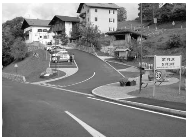
Comune di Senale – San Felice, sistemazione della piazza municipale.