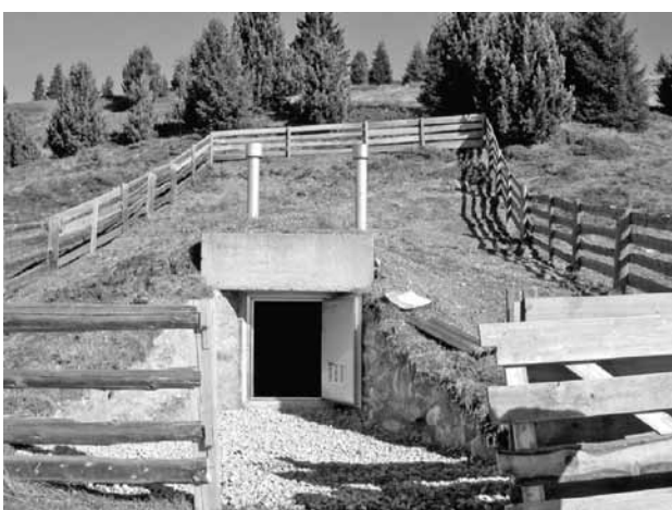
Serbatoio di raccolta