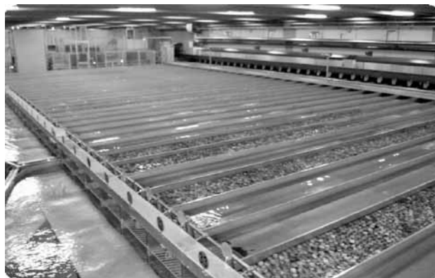
Sala di lavorazione (macchina selezionatrice)

Nel 2012 sono stati ammessi a contributo 5 progetti per un importo totale di € 16.636.922,00 e corrispondentemente sono stati impegnati contributi per € 6.241.076,60 .