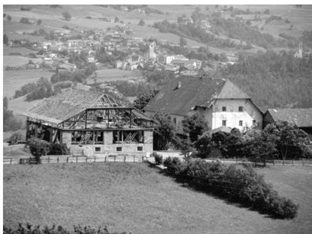
Ricostruzione di un edificio agricolo