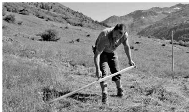
Sfalcio dei prati in montagna

I tecnici pianificano l'organizzazione della campagna annuale, la raccolta delle domande di conferma e/o di modifica (tramite SBB), l'istruttoria tecnico - amministrativa delle domande e la preparazione delle liste di liquidazione dei premi, collaborando con gli altri uffici provinciali.