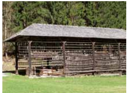
Foto links // sinistra: Innsbruck, Panoramagebäude // edificio del ciclorama Rechts // destra: Leiterharpfe