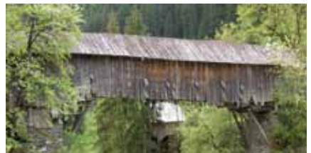
Foto links // sinistra: Hall in Tirol, Rathaus // municipio Rechts // destra: Strengen, Rosannabrücke // ponte Rosanna