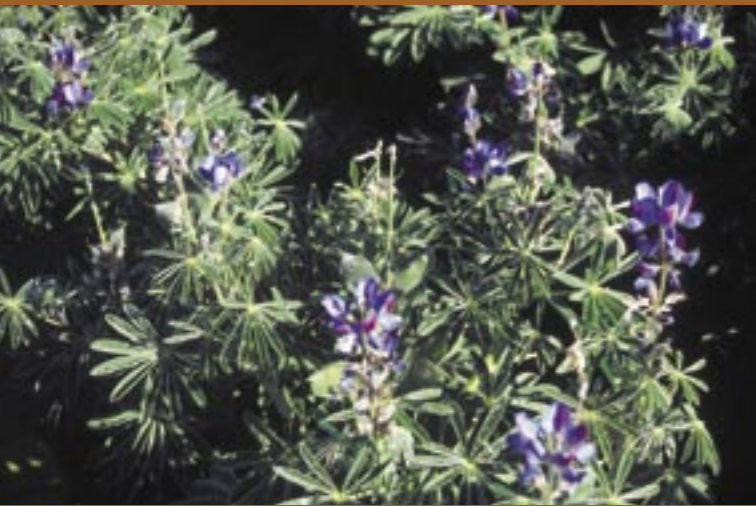
Blüte der Lupine "Altreier Kaffee" Infloreszenz del tipo di lupino "Caffè di Anterivo"

Dieser Schilderung können wir nicht entnehmen, ob es sich um die eigene Beobachtung des Hofkaplans handelt, oder nicht. Wir können auch vermuten, dass diese Beschreibung einer mündlichen Schilderung des Bischofs Johann Zwerger entstammt. Interessant ist dieses Zitat jedoch im dreifachen Sinne: Zum einen belegt es, dass der Anbau der Lupine in Altrei über 100 Jahre alt ist, zum anderen, dass auch der Name "Altreier Kaffee" bereits zu dieser Zeit geläufig war. Drittens ist die Erwähnung, dass der Kaffee zu dieser Zeit auch vermarktet wurde, ein Hinweis, dass der Kaffee nicht nur für den Eigenbedarf, sondern wohl auch in größerem Umfang angebaut wurde.