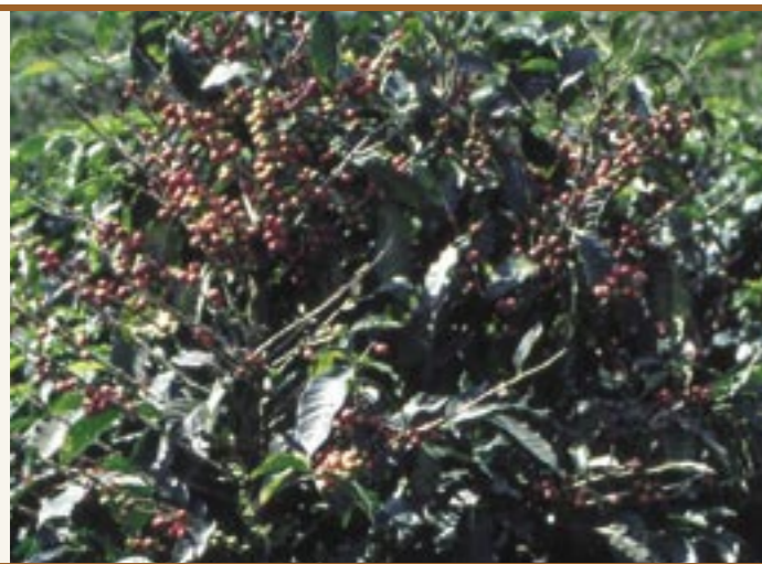
Kaffee-Strauch mit sehr reichem Fruchtbehang Arbusto di caffè con abbondante carico di frutti.

Ein Erbe der Kolonialzeit ist bis heute die Aufteilung in "Länder des Kaffeeanbaus" und "Länder des Kaffeekonsums": Die Weiterverarbeitung des Rohkaffees erfolgt größtenteils in den Industrieländern. Die traditionelle Rolle der Länder des Südens zeigt sich auch darin, dass etwa zwei Drittel des Verbraucherpreises in den Industrieländern verbleiben. Den Kaffeebauern der so genannten "Dritten Welt" kommt nur ein Bruchteil des Kaffee-Endpreises zu. Organisationen wie "Faire Trade" oder die Weltläden sind bestrebt, die Aufteilung der Gewinne aus dem Kaffeehandel gerechter zu gestalten.