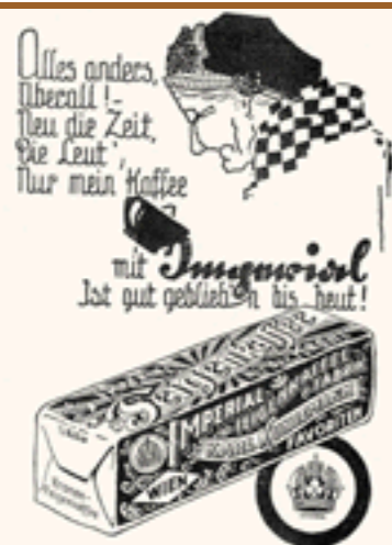
Werbung für den Imperial-Feigenkaffee aus dem Jahr 1926, Wien Pubblicità del caffè di fichi "Imperial", Vienna 1926

Erwin Franke schreibt in seinem umfangreichen Werk zu Kaffee und Kaffeesurrogaten aus dem Jahr 1920, dass Lupinen vor dem Rösten entbittert werden müssten. In seinem Werk ist auch der Hinweis zu finden, dass Lupinen in Tirol als Bauernkaffee bezeichnet werden. 10