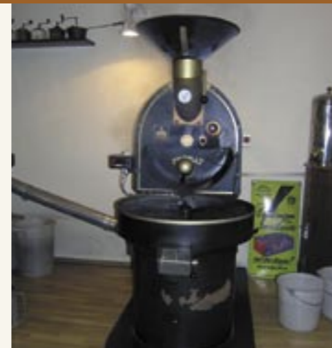
Röstmaschine in Betrieb Macchina per la tostatura in funzione