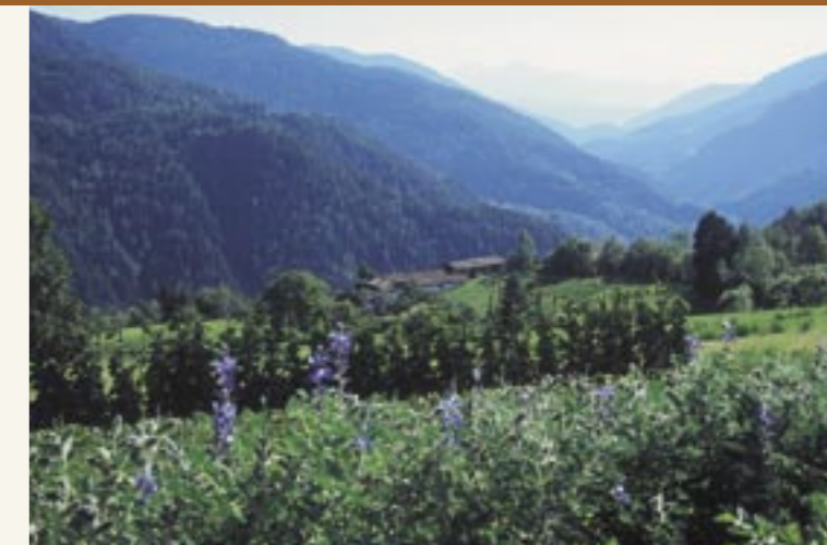
"Kaffeeacker" mit Blick ins Cembratal "Campo di caffè" con vista sulla Val di Cembra

Il caffè di Anterivo è parte della memoria collettiva degli abitanti dell'omonimo paese; molti di loro lo hanno coltivato e/o bevuto personalmente, altri ricordano di averlo visto coltivare dalle loro madri, nonne o zie. Per documentare quest'arte locale e consolidare il ricordo storico e culturale del Caffè di Anterivo, sono state realizzate, avvalendosi degli strumenti della ricerca sociale qualitativa, 11 interviste alla popolazione locale che poi sono state registrate su nastro. Poiché alcuni colloqui hanno visto coinvolti 2 o più interlocutori, in totale le persone che vi hanno preso parte sono state 15. I colloqui sono stati condotti sotto forma di interviste semi-strutturate,