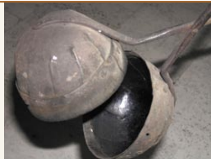
Kugelröster für den Hausgebrauch aus Vintl, Pustertal Tostacaffè di Vandoies a forma di palla per uso domestico

Albina Erschbamer di Vilpiano a proposito del caffè di malto raccon-