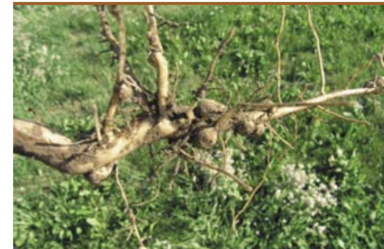
Knöllchenartige Verdickungen an den Wurzeln Protuberanze a forma di tubercolo sull'apparato radicale delle piante

che gli ha consentito di analizzare in breve tempo vaste popolazioni di piante, lo scienziato Reinhold von Sengbusch ha potuto determinare il contenuto di alcaloidi di un elevato numero di esemplari. Su un campione di 1,5 milioni di individui è riuscito a selezionare 3 piante di lupini gialli e 2 piante di lupini blu praticamente prive di queste sostanze amare, creando così il presupposto per la selezione dei cosiddetti “lupini dolci”. 16 Insieme a quelli di soia i semi del lupino dolce sono i semi a più elevato contenuto proteico e di sostanze grasse. Si definiscono “dolci” le specie il cui contenuto di alcaloidi si trova sotto la soglia dello 0,03%. 17 Le specie più antiche di questi lupini presentano livelli di alcaloidi più alti che dovevano essere rimossi, mettendo ripetutamente a bagno i semi prima del loro consumo.