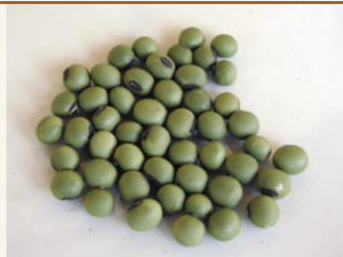
Grünsamige Soja-Sorte Varietà di soia dai semi verdi