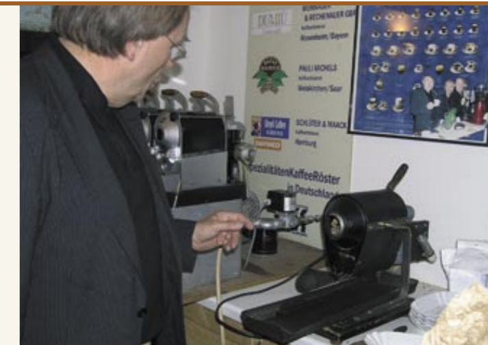
Proberöstung des Altreier Kaffees in der Rösterei Hagen, Heilbronn, Juni 2005 Tostatura di prova del Caffè di Anterivo nella tosteria Hagen, Heilbronn, giugno 2005

I singoli ingredienti venivano tostati separatamente, poiché l'orzo, il frumento ed il lupino Caffè di Anterivo hanno bisogno di tempi diversi per giungere alla tostatura. In alcune zone il caffè veniva