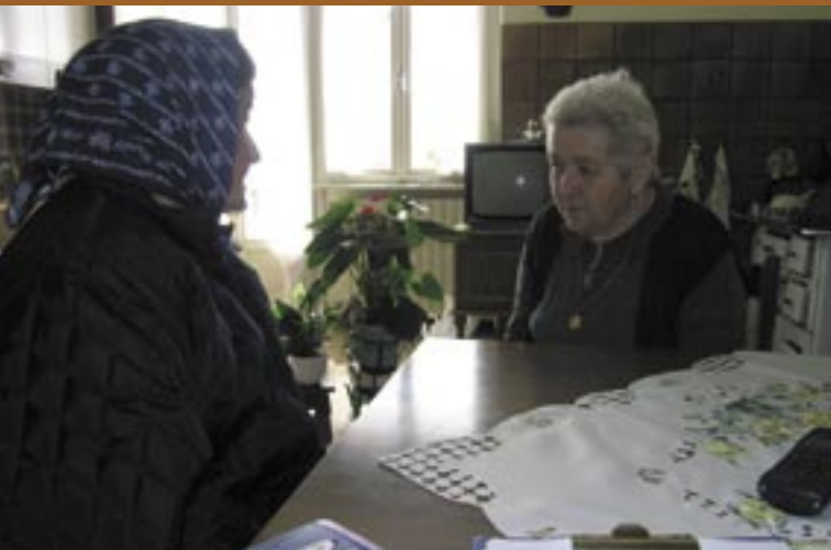
Im Gespräch erinnern sich zwei gebürtige Altreierinnen an "ihren" Kaffee Durante il colloquio due signore native di Anterivo ricordano il "loro" caffè

Altrei ist ein auf 1200 Meter Höhe gelegenes Bergdorf an der Grenze der Provinzen Südtirol und Trentino. Altrei liegt somit an der italienisch-deutschen Sprachgrenze. Aufgrund seiner geografischen Lage ragt das Gemeindegebiet von Altrei wie eine Zunge in die Provinz Trient, die nächst gelegene Gemeinde Capriana gehört bereits zur Provinz Trient. Die Gemeinde hat rund 380 Einwohner. Altrei ist trotz seiner Höhe klimatisch begünstigt, da es auf einer südexponierten Terrasse angelegt ist. Altrei ist vom Naturpark Trudner Horn umgeben, die Landschaft um das Dorfzentrum ist geprägt von Wiesen, in die immer wieder kleine Gemüse- und