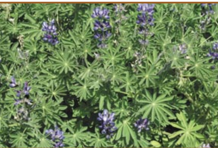
Der Altreier Kaffee ist eine Lupinen-Art Il "Caffè di Anterivo" è una varietà di lupini

Die Altreier "Kaffeebohne" stammt von einer Pflanze, die genau genommen weder Kaffee noch Bohne ist: Der Altreier Kaffee ist eine Lupinenart, die über Jahrzehnte einen Kaffee lieferte, der gemischt mit Gerste oder Weizen getrunken wurde. Diese Pflanze heißt Altreier Kaffee und ist eine lokale Spezialität: sowohl botanisch, wie auch aus Sicht der Südtiroler Kulturgeschichte. Der Kaffee, der in Form von wenigen Pflanzen und Samen die letzten Jahrzehnte von einigen Frauen in Altrei gehütet wurde, belebt nun neu die Geister: Welches Potential schlummert in einer lokalen Spezialität für Landwirtschaft und Tourismus eines abgelegenen Bergdorfes? Lässt sich auch heute ein Kaffee-Surrogat daraus entwickeln? Wie schmeckt der Kaffee? Wie lässt er sich kultivieren? Wie kann er mit modernen Techniken geröstet werden?