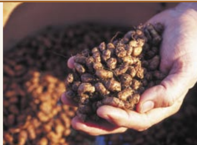
Erdmandeln frisch geerntet Dolcichini o babbaggi

del caffè è documentato sia dalla letteratura che dai racconti degli anziani.