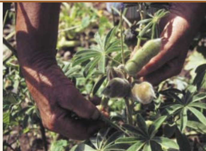
Das "Schabigen" der "Kaffeepflanzen" Asportazione dei baccelli della „pianta da caffè“