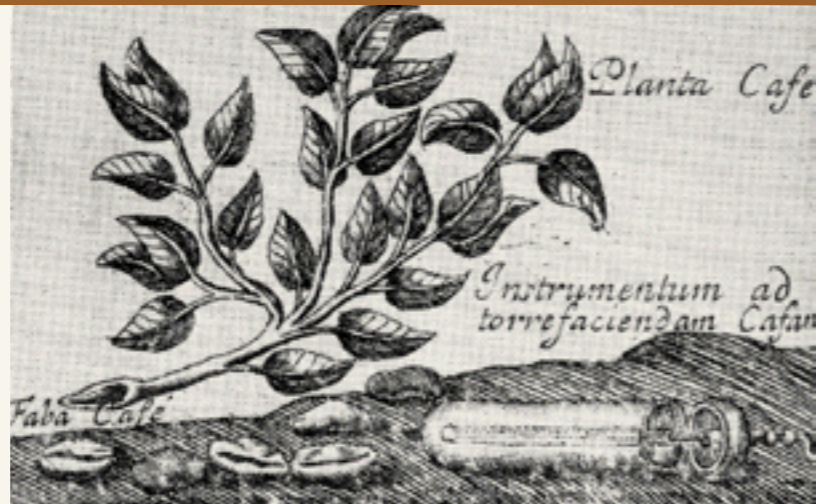
Questa incisione su rame, proveniente da Parigi, risale all'anno 1685 e raffigura la pianta del caffè, un apparecchio per la tostatura ed un bevitore turco di caffè.

Blutdruck und Körperwärme erhöht, die Nierentätigkeit verbessert, aber die Hauttätigkeit vermindert. Übermäßiger Kaffeegenuss kann Überreizung, Schlaflosigkeit, Muskelzittern verursachen. Womit wir wieder bei den Alternativen des Bohnenkaffees wären, den Kaffee-Surrogaten, die aus diesem Grund auch immer wieder als "Gesundheitskaffee" bezeichnet wurden. Wer gleich mehr zu Kaffee-Surrogaten wissen möchte, kann die folgenden Seiten überspringen und auf Seite 16 weiterlesen.