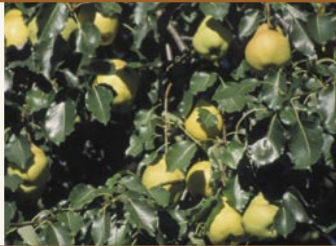
Birnen der Sorte ‚Palabirne‘ Pere della varietà „Pala“