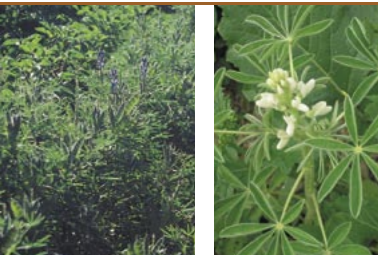
Die Blaue Lupine ( Lupinus angustifolius ) Il lupino blu ( Lupinus angustifolius )

Lupinen sind aufgrund ihrer attraktiven Blüten wohl den meisten Menschen bekannt. Man kennt sie als Zierpflanzen aus Gärten und als Ruderalpflanzen, die entlang von Waldsäumen und Rainen