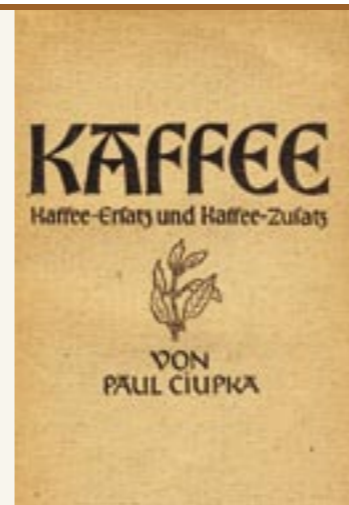
Pubblikation 1949 Pubblicazione del 1949