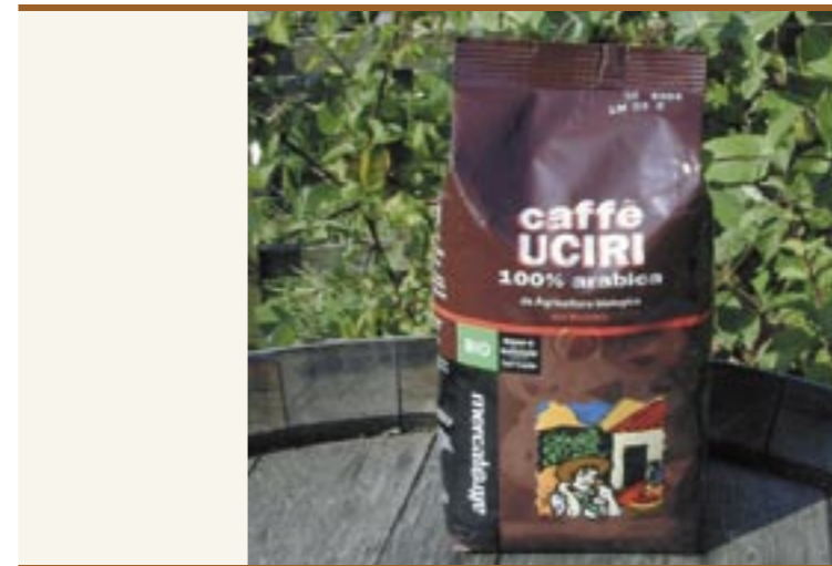
Kaffee UCIRI Caffè UCIRI

La suddivisione in Paesi produttori e Paesi consumatori di caffè è rimasta un'eredità del periodo coloniale: la lavorazione del caffè grezzo attualmente avviene principalmente nei Paesi consumatori. I Paesi del Sud continuano a svolgere il loro ruolo tradizionale, infatti, circa 2/3 del prezzo al consumo è destinato ai Paesi industriali. Ai coltivatori del cosiddetto "Terzo Mondo" spetta solo una minuscola parte del prezzo finale del caffè. Organizzazioni come "Faire Trade" o le "Botteghe del Mondo" mirano a creare un commercio del caffè equo e solidale.