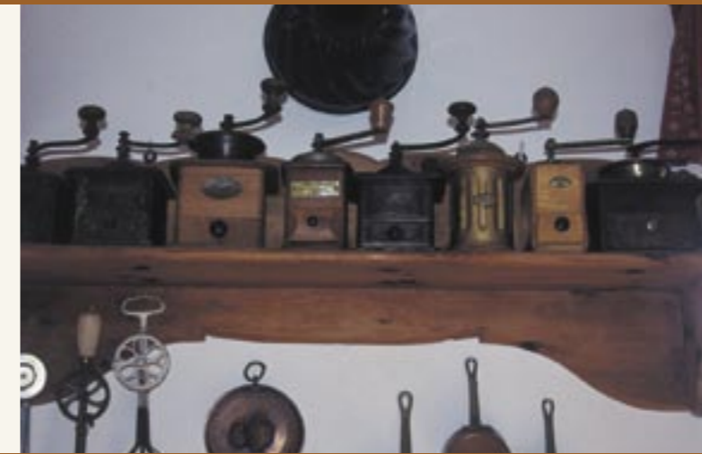
Kaffeemühlen Macinini per il caffè