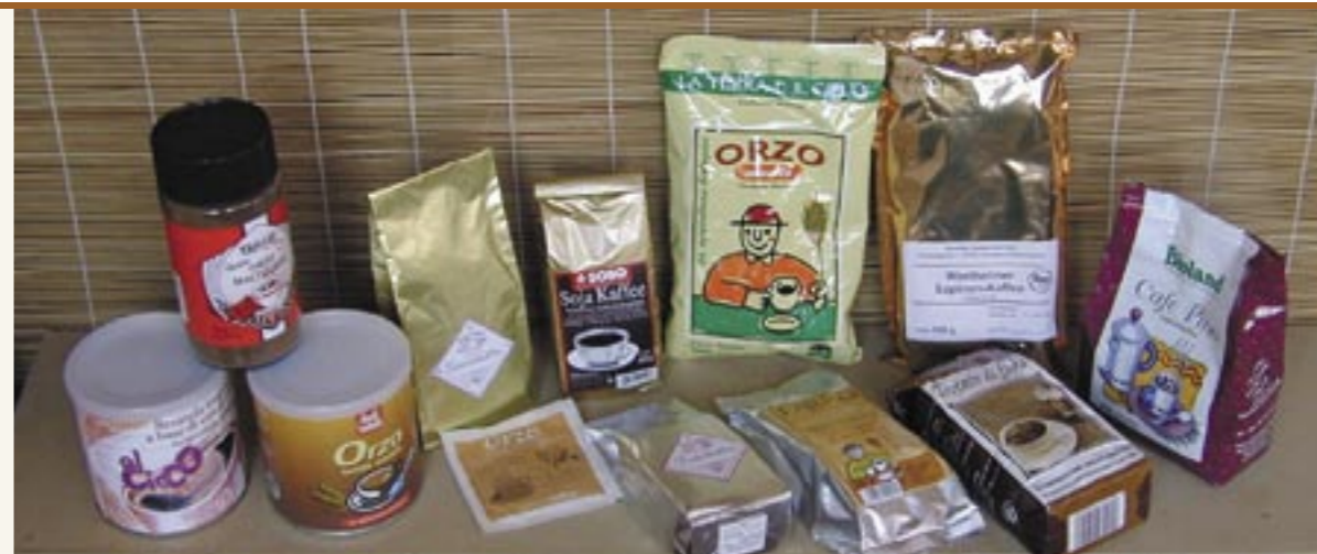
Verschiedene Kaffee-Ersatz-Produkte aus Italien, Deutschland und Österreich (2005) Varie confezioni di surrogati di caffè provenienti dall'Italia, dalla Germania e dall'Austria (2005)

Erwin Franke nel 1920 dedica un'ampia opera al caffè e ai suoi surrogati, in cui scrive che i lupini, prima di essere tostati, devono essere deamarizzati. Dall'opera, inoltre, si evince che i lupini in Tirolo venivano chiamati "Bauernkaffee" (caffè del contadino). 10