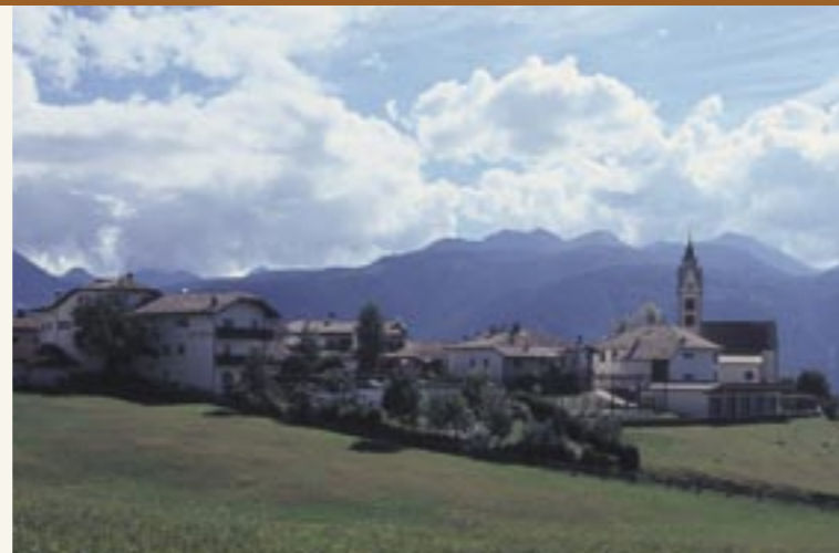
Die Ortschaft Altrei La località di Anterivo

Der Altreier Kaffee ist Teil des kollektiven Gedächtnisses der Menschen in Altrei, viele Menschen haben den Kaffee früher selber angebaut und/oder getrunken, andere erinnern sich, dass ihre Mütter, Großmütter oder Tanten den Kaffee angebaut haben. Um dieses Wissen und die Erinnerung an die lokale Kulturgeschichte des Altreier Kaffees zu dokumentieren, wurden mittels Methoden der Qualitativen Sozialforschung 11 Gespräche mit Menschen aus Altrei geführt, die auf Tonband dokumentiert wurden. Bei einigen Gesprächen waren 2 oder mehr Personen anwesend, so dass in Summe 15 Personen an diesen Gesprächen teilgenommen haben.