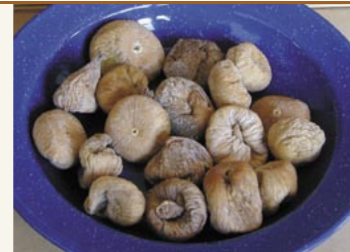
Getrocknete, handelsübliche Feigen Fichi secchi acquistabili nei negozi

Nella letteratura troviamo molti riferimenti all'impiego dei lupini in