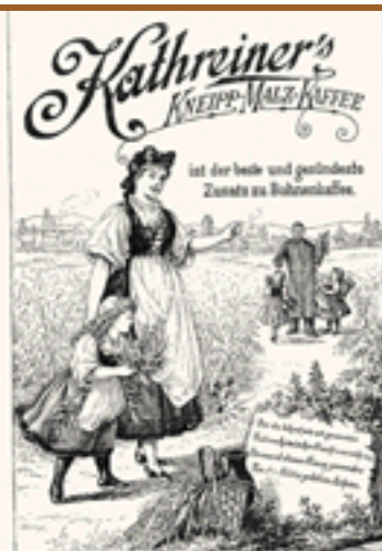
Kathreiner Malzkaffee, Ende 19. Jahrhundert “Kathreiner Malzkaffee“, fine del XIX sec.

Il caffè di segale viene descritto come surrogato molto amaro. Anche la segale veniva maltata come l'orzo e nell'area germanofona fu commercializzata con il nome di “Roggenmalzkaffee“ (caffè di malto di segale).