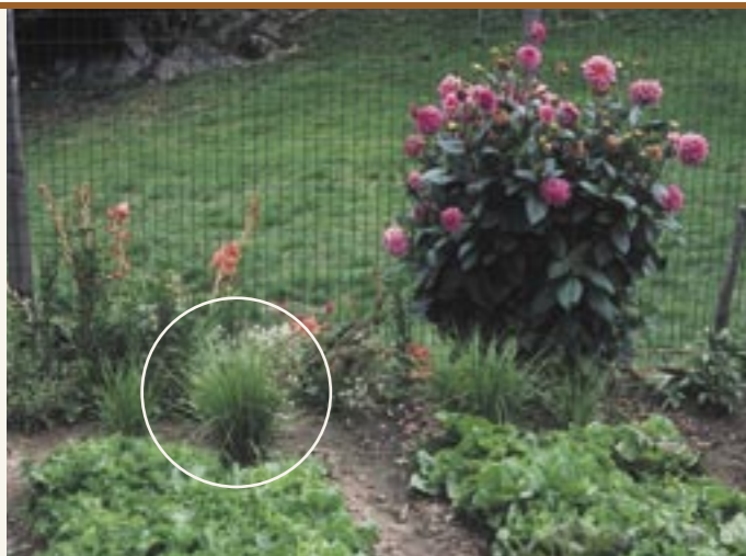
Erdmandel-Pflanzen (Im Kreis) Cypero dolce (nel cerchio)

In der Literatur finden sich zahlreiche Hinweise, dass in Tirol Lupinen als Kaffee-Ersatz genutzt wurden. Im sehr umfangreichen,