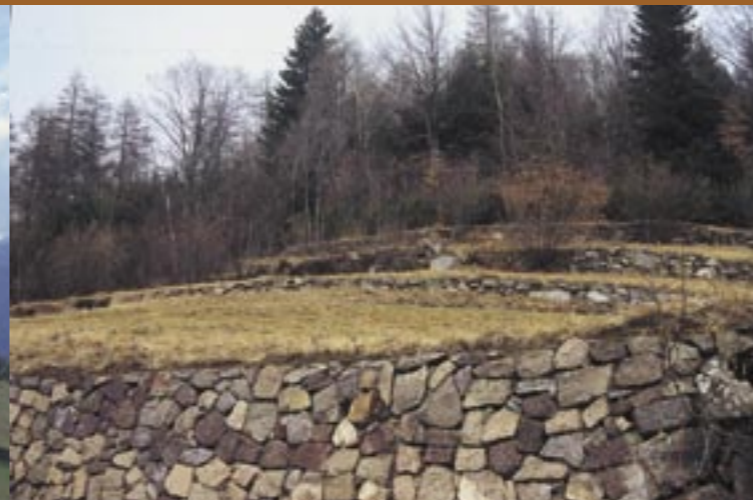
Steinmauern zeigen Spuren der ehemaligen Getreideäcker Muretti di sassi testimoniano la presenza di antichi campi di cereali

Anterivo è un paesino di montagna situato a 1200 m di altitudine al confine tra l'Alto Adige ed il Trentino e segna quindi il confine linguistico tra l'area italiana e quella tedesca. Per la sua posizione geografica il comune di Anterivo si estende infatti su una lingua di terra che si insinua nel territorio della provincia di Trento, a cui già appartiene il vicinissimo comune di Capriana. Il comune conta circa 380 abitanti. Nonostante l'altitudine, Anterivo gode di un clima particolarmente favorevole, in quanto situato su una terrazza soleggiata esposta verso sud. La località si trova immersa nell'area del Parco Naturale Monte Corno ed il centro del paese è incorniciato