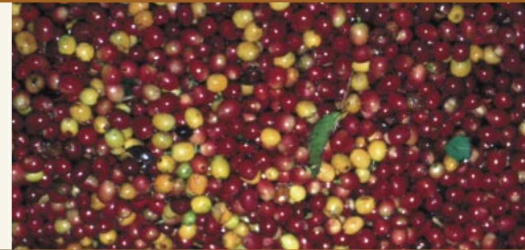
Die Früchte (Kaffeekirschen) des Kaffees. I frutti del caffè (ciliegie del caffè).

lassen. Viele Menschen trinken andere Getränke wie Tee oder eine heiße Schokolade, oder einen Gerstenkaffee. Damit sind wir bei einem Getränk angelangt, das jüngst in viele Kaffee-Häuser und Bars Einzug gehalten hat. Es bringt ein gestiegenes Gesundheitsbewusstsein vieler Menschen zum Ausdruck und längst haftet dem Gersten-Kaffee nicht mehr der Ruf eines geschmacklosen Gebräus an, das nur ökologische Gesundheitsfanatiker trinken würden.