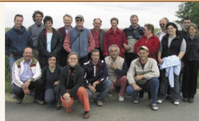
Altreierinnen und Altreier zu Besuch beim Wertheimer Lupinen-Kaffee (aus der Weissen Lupine hergestellt) Abitanti di Anterivo in visita presso i coltivatori di lupini bianchi a Wertheim

Wissen zum Altreier Kaffee und anderer Kaffee-Ersatz-Pflanzen in Südtirol zu dokumentieren und festzuhalten. Darüber hinaus wird durch Inhaltsstoffanalysen, Proberöstungen und Geschmacksverkostungen erlassen, ob aus der Lupinenart ein interessanter Kaffee-Ersatz entwickelt werden kann.