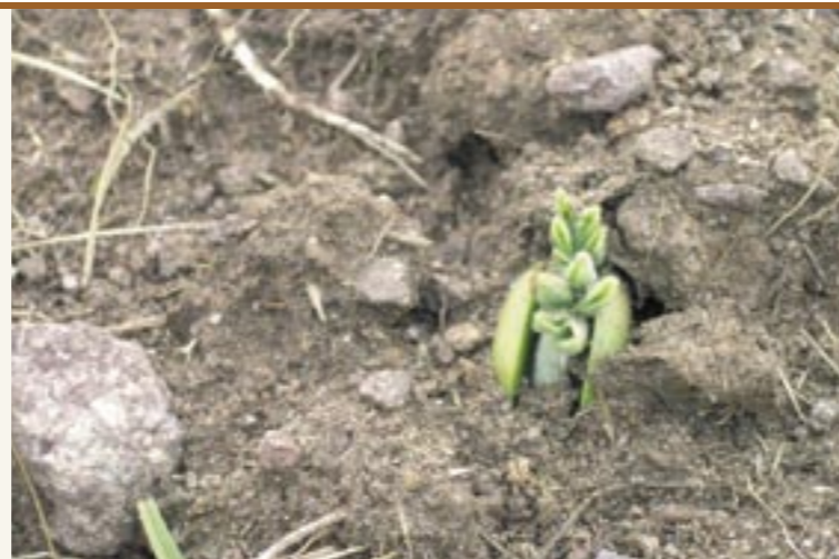
Keimender Same der Lupine "Altreier Kaffee" Seme germogliato del "Caffè di Anterivo"