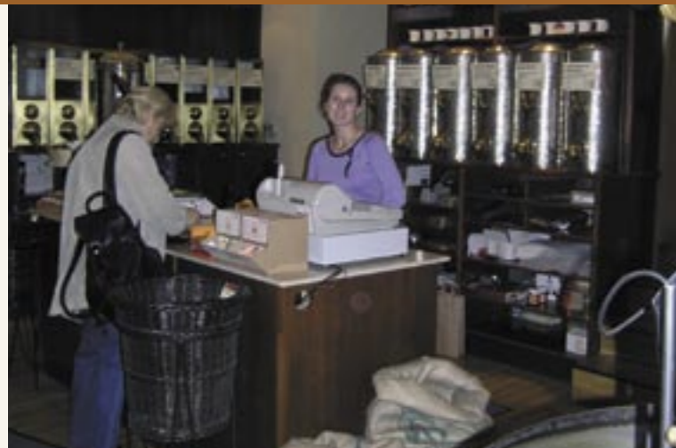
Wien hat eine lange Kaffee-Tradition (Kaffeerösterei Alt-Wien) Vienna vanta una lunga tradizione nella torrefazione del caffè (tosteria "Alt-Wien")

Nel corso del XVIII e del XIX secolo il caffè si diffuse su vaste aree dell'America Centrale e dell'America del Sud, spesso in relazione al fenomeno della schiavitù, per poi tornare nuovamente in Africa nel XIX e XX secolo, sempre grazie ai legami coloniali.