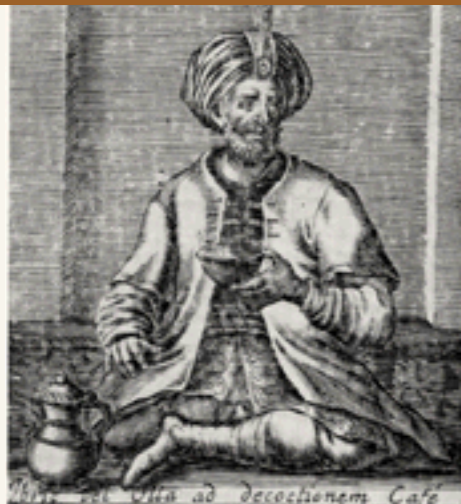
Dieser Kupferstich aus Paris stammt aus dem Jahre 1685 und zeigt die Kaffeepflanze, einen Röstapparat und einen türkischen Kaffeetrinker.

Die Geschichtsschreibung der Wiener Kaffeehäuser liest sich etwas anders: Von Wien wird berichtet, dass die ersten Kaffeebohnen gemeinsam mit dem Wissen um ihre Zubereitung von den türkischen Belagerern während der zweiten Türkenbelagerung der Stadt im Sommer des Jahres 1683 eintrafen. So hat diese Belagerung der Stadt auch ein Erbe hinterlassen, auf dem eine ganze Dynastie von Kaffeehäusern aufbaut und Wiener Schulkinder im Heimatkundeunterricht