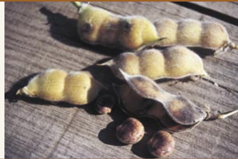
Samen der Lupine "Altreier Kaffee" Seme del tipo di lupino "Caffè di Anterivo"