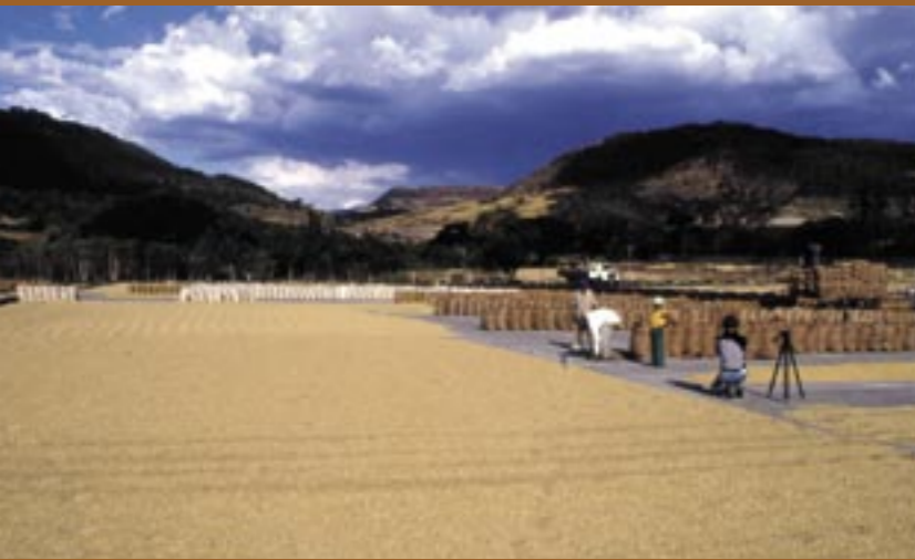
Kaffee ist ein weltweites Handelsgut. Transportiert werden die gereinigten, aber noch ungerösteten Kaffeebohnen in Jutesäcken. Il caffè è un bene commerciale diffuso in tutto il mondo. I chicchi di caffè puliti, non ancora tostati, vengono trasportati in sacchi di iuta.

Il caffè viene ricavato dai semi di diverse varietà della specie botanica Coffea , la quale appartiene alla famiglia delle Rubiaceae , originarie soprattutto delle regioni tropicali. La varietà di caffè più