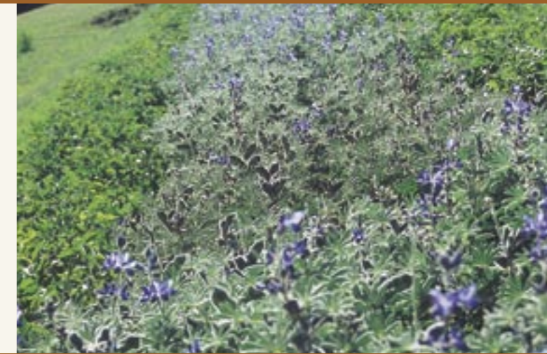
Pflanzen der Lupine "Altreier Kaffee" Pianta del tipo di lupino "Caffè di Anterivo"