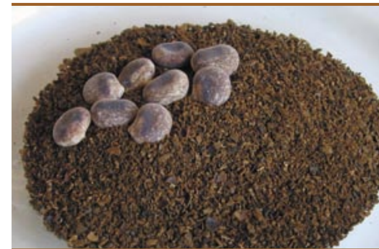
Altreier Kaffee: Samen und gemahlenes Pulver Caffè di Anterivo: semi interi e macinati

L'opuscolo si apre con un accenno alla storia e alla tradizione culturale del caffè e del suo utilizzo come bevanda. Il vero caffè è sempre stato un prodotto coloniale, che non potendo essere coltivato in zone con un clima temperato come le nostre, doveva essere im-