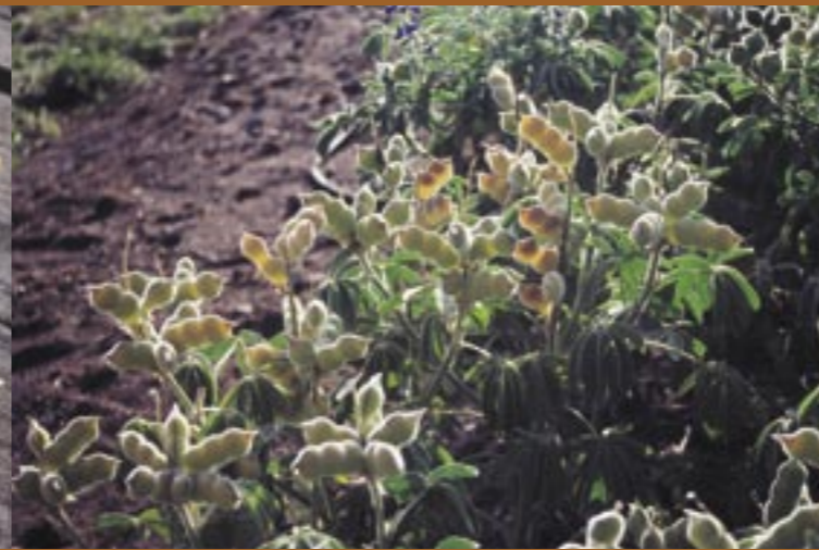
Hülsen der Lupine "Altreier Kaffee" Baccello del tipo di lupino "Caffè di Anterivo"