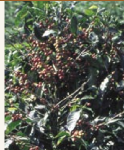
Kaffee-Strauch mit sehr reichem Fruchtbehang. Arbusto di caffè con abbondante carico di frutti.