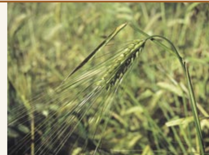
Gersten-Ähre Spiga d'orzo

Anche in Alto Adige l'orzo, la segale e fichi coltivati nel proprio orto erano le materie prime più importanti per la preparazione del caffè. Gli anziani interpellati in merito ai surrogati del caffè, inoltre, ricordano anche le seguenti piante: cipero dolce, soia e lupini. La cosa interessante è che tutte e tre necessitano di un clima caldo. In Val Venosta si narra anche dell'impiego della cosiddetta „pera Pala“ quale surrogato del caffè.