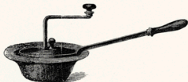
Abb. 7. Veralteter Kaffeeröster für Hausgebrauch.