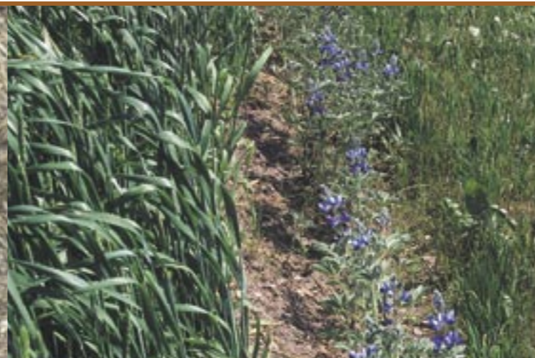
Meist wurde der "Altreier Kaffee" in einer Zeile am Getreideacker angebaut Di solito il "Caffè di Anterivo" veniva piantato in una fila nei campi di cereali